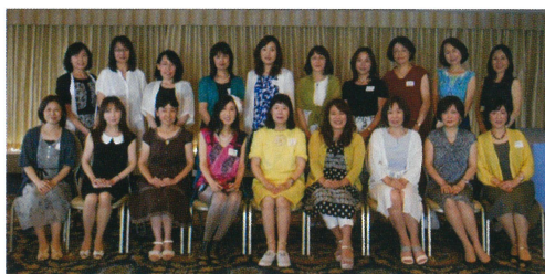
2016年8月11日 名古屋観光ホテル