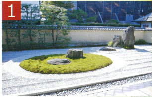
1 大徳寺 大仙院、龍源院と見学。方丈を囲む枯山水の庭園はどれも白砂と石庭の織りなす世界観に感銘。