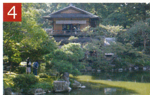
4 拾翠亭 九條家の別邸。一階は茶室、二階は座敷になっています。前に広がる九條池には様々な鳥の姿が見られました。