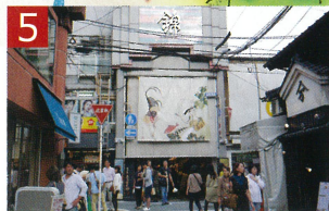
5 錦市場 外国人観光客で混雑していました。