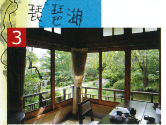
3 吉田山荘 元東伏見宮家別邸として建てられた料理旅館です。昭和初期の面影を感じながら、美しく盛り付けられた京懐石をいただきました。