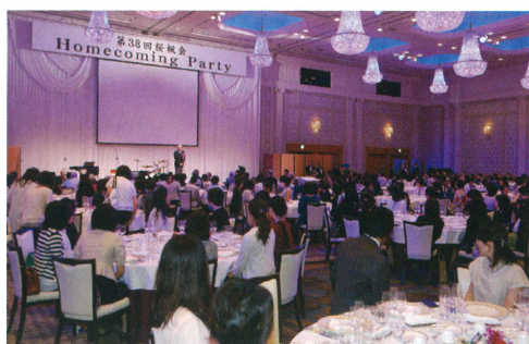
2016年9月17日 名古屋 Marriott アソシアホテル

しかし実際、花束を渡すときになったら嫌がらず、壇上に上がっていただきさらに簡単なインタビューまで応じていただけまして、華甲