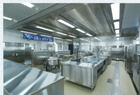
給食経営管理実習室