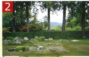
2 円通寺 比叡山を借景にした「枯山水庭園」にご住職から庭園にまつわる貴重なお話をお聞きすることができました。