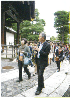
京都の地形と自然 今回の見学場所の位置