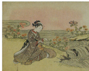
鈴木春信「流れのほとりで菊を摘む女(見立菊慈童)」明和2(1765)年頃 William Sturgis Bigelow Collection 11.19443 Photographs ©2017 Museum of Fine Arts, Boston

結果：当選通知(優待チケット購入方法記載)を8月10日までに発送いたします。(当選者のみ)