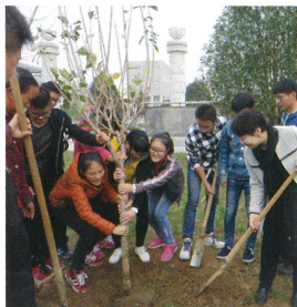
桜の植樹(安徽省「第2回長江こども環境サミット」にて)