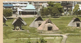
登呂遺跡 弥生時代の集落・水田遺跡。 国の特別史跡に指定されている。

する美術館で、今回初めて拝見しましたが、4~50年以上前のものとは思えないほど斬新で大胆な構図でありながらシックな色調のテキスタイルに感銘を受けました。静岡浅間神社ではグループごとにガイドの方に案内していただき効率的にパワースポットを参詣することができました。きっと