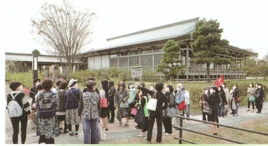
いつきのみや歴史体験館

齋宮がもっとも栄えた平安時代を中心に歴史や文化を学べる施設。目の前に広がるコスモス畑がとても素敵でした。